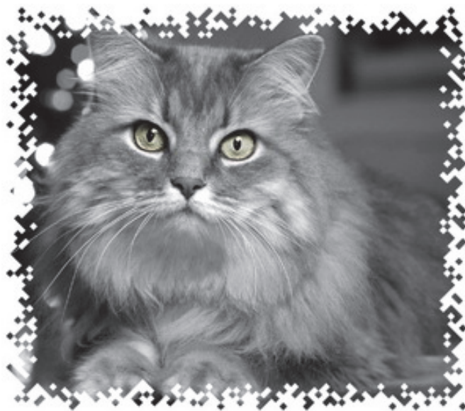
他们住在上海 (中国) They live in Shanghai (China)