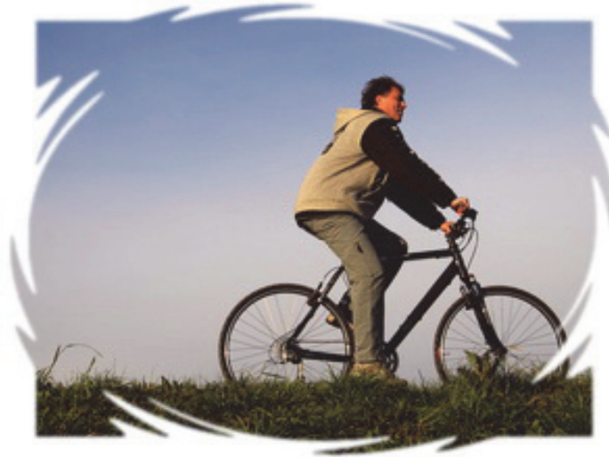
里买自行车 Ri buys a bike